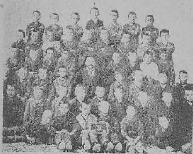
طفلی که با علامت (X) در ردیف بالانفر چهارم مشخص شده «هیتلر» دراوان کودکی در دبستان است

در راه یگانه اصل مهم که عبارت از تحصیل آزادی اراضی اصلی است، فدا گردیده آرزوهای ستم کشیدگان و اعتراضات ملیون قسمتهای تجزیه گشته يك ملت یا ایالات رایش را آزاد نمی کند بلکه چیزی که موجب این آزادی میشود اعمال قدرت و زور است و این کار باید بدست بقایای چیزی که در سابق وطن مشترک نام داشت و کمابیش استقلال دارد،