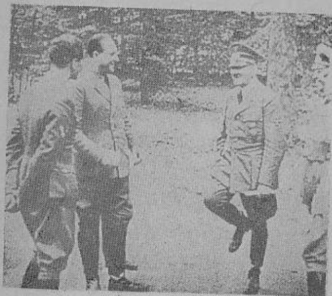
ورود بختک فرانسه برای انعقاد قرارداد

مارا توجیه و تأیید کند . در برابر خدا ... برای آنکه ما برای این باین دنیا آمده ایم که ثان روزانه خود را بقیمت نبرد دائم و پایان ناپذیر بدست آوریم ... آری ما مخلوقاتی هستیم که هیچ چیزی برای گان و بیز حمت به ما داده نشده است و سیادت خود را در روی زمین مرهون کوشش و هوش